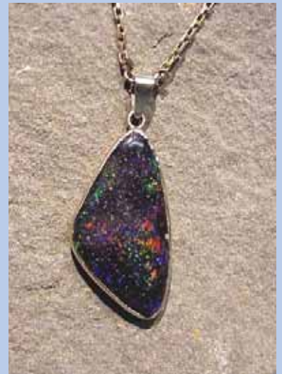
Dije con Ópalo hondureño

Las formaciones opaleras hondureñas se han dado exclusivamente en el occidente de nuestro país, específicamente en el Departamento de Lempira. A partir del ópalo se pueden fabricar joyas de increíble belleza que son muy apetecidas y muy bien valoradas a nivel internacional. El principal productor de ópalo a nivel mundial es Australia, nación que cuenta con las mismas variedades que se encuentran en nuestro país. El Ópalo ha sido y sigue siendo una de las gemas favoritas de la realeza y del Jet Set europeo.